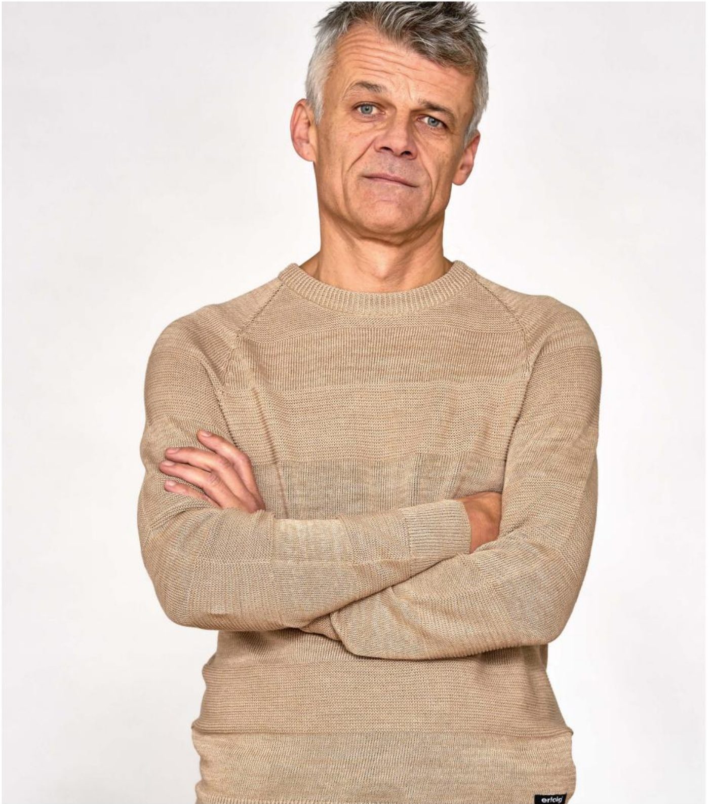
Pull SPF 15 aus 50% Schweizer Leinen / 50% biologische Baumwolle in Nomad/Beige