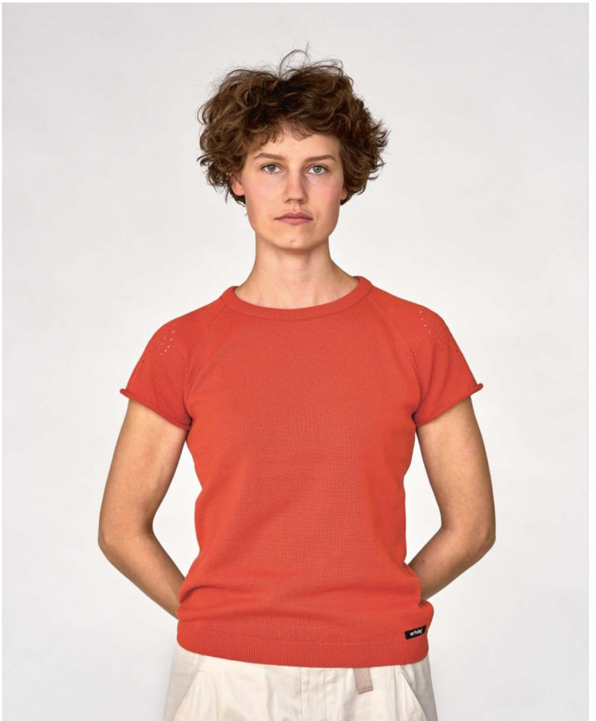
Pull Amica June aus 100% biologischer Baumwolle in Brandy